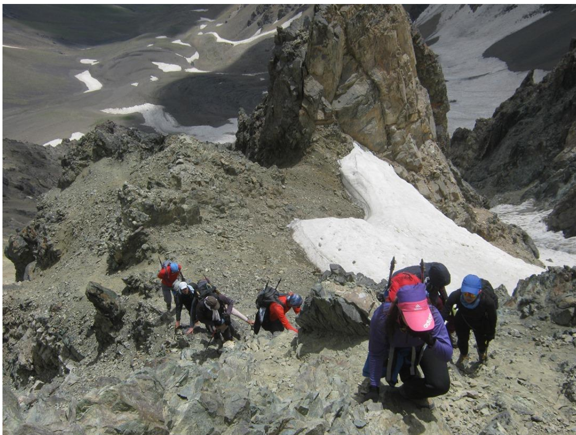
مسیر سیاه سنگ